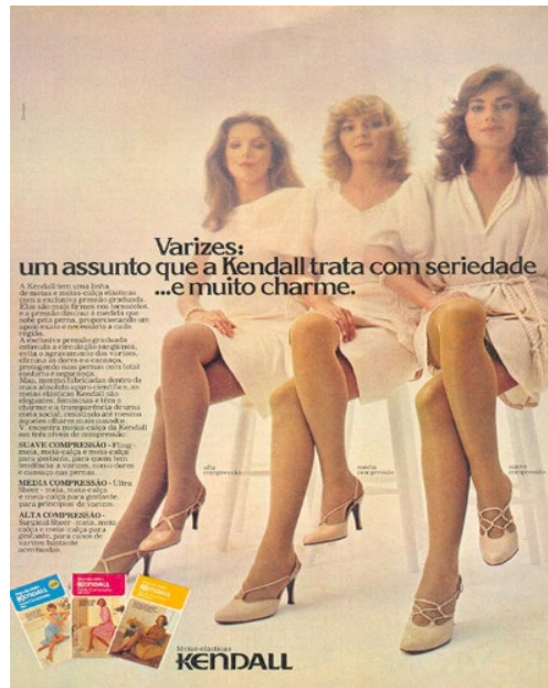
Figura 2 - Propaganda Kendall, em 1979